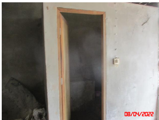
รูปที่ 2-19 การตรวจวัดคุณภาพอากาศ ระหว่างวันที่ 8-11 เมษายน 2565