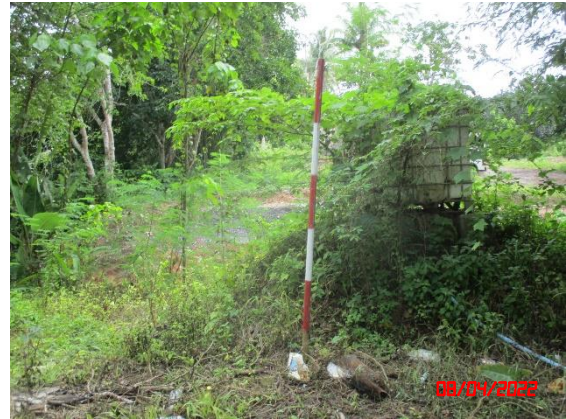
รูปที่ 2-5 พื้นที่หน้าเหมืองปัจจุบัน