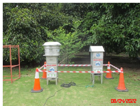
บ้านราษฎรทางทิศตะวันตก