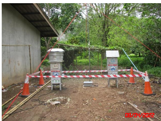
บ้านราษฎรทางทิศเหนือ