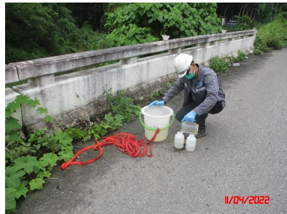
ห้วยบอนก่อนไหลผ่านพื้นที่โครงการ