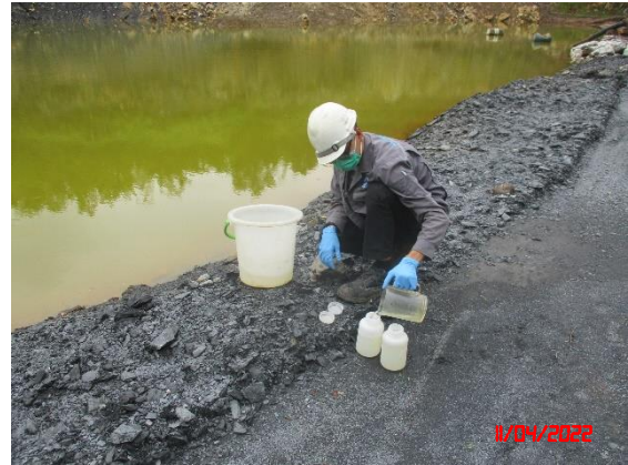
บ่อเหมืองทางทิศใต้