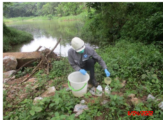
บ่อเหมืองทางทิศเหนือของโครงการ