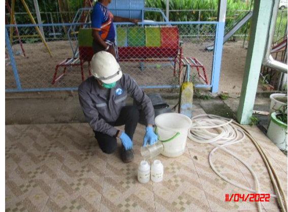
บ่อบาดาลโรงเรียนบ้านคลองปราบ