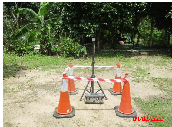
บ้านราษฎรทางทิศตะวันตก