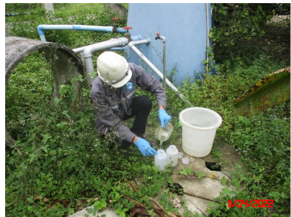
บ่อบาดาลหมู่ที่ 1 บ้านพุดพิ่ง