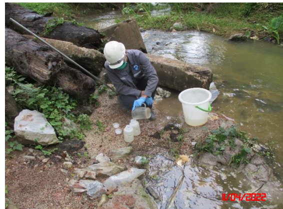
ห้วยบอนหลังผ่านพื้นที่โครงการ