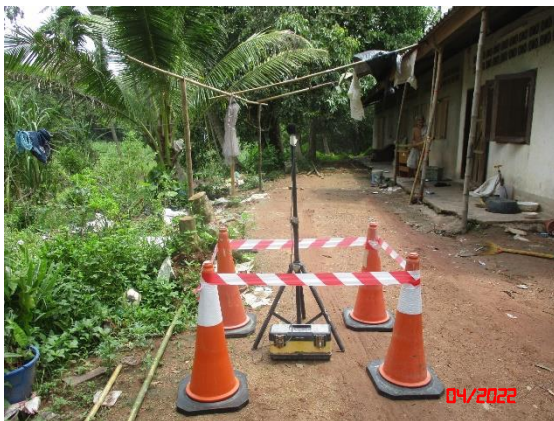
บ้านราษฎรทางทิศเหนือ